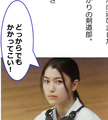
映画 武士道シックスティーン より

暑い盛りもやっと落ち着いたと思いきや、まだ少しすっきりしない日が続いていますね。 でも確実に空は高くなってきました。その分これからスカッとした秋晴れが続いてくれることでしょう。 秋といえばスポーツの秋。 今年オリンピック・パラリンピックイヤーでしたが、全国の部活少女にとっても、「新人戦」の季節。 今年春から中学生になったウチのお姉ちゃんも、迷った末に小学生から続けている剣道を部活に選びました。 とはいえ、昨年度創部されたばかりの剣道部。娘以外は全員初心者の部員たち。 今年も娘たち一年生の加入で、ギリギリチームを組むことができやっとなんか戦地区予選に団体出場することができました。 入部して半年。 決して恵まれた環境とは言えない中で色々悩みもあったようですが、一年生レギュラーとしてチームの突撃隊長、先鋒を任された娘。どんな戦いぶりを見せてくれるのか? もちろん、私も応援に行ってきたのですが、 ・・・そして事件は起こったのです。 ニュースレター秋号お届けです!